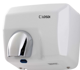
REF: CS-500-X Acabado METAL LACADO BLANCO