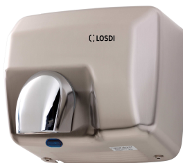
REF: CS-500-S/X Acabado ACERO SATINADO