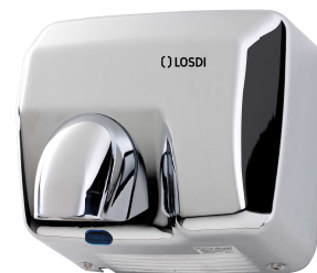
REF: CS-500-I/X Acabado ACERO BRILLO