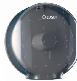
REF: CP-0205 Acabado FUMÉ