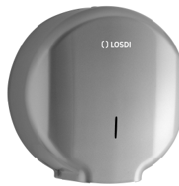
REF: CP-0205-CG Acabado PLATA