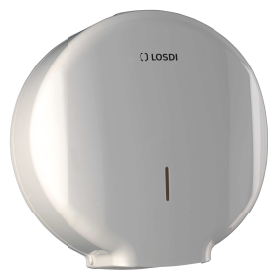
REF: CP-0205-B Acabado BLANCO