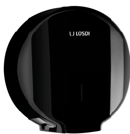
REF: CP-0205-C-BL Acabado NEGRO