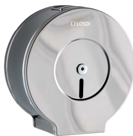
REF: CO-0202-F Acabado SATINADO