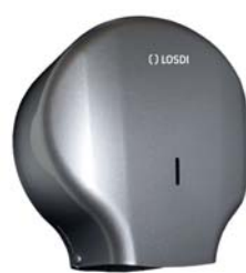
REF: CP-0204-CG Acabado PLATA