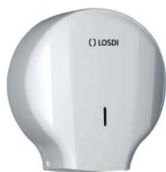
REF: CP-0204-B Acabado BLANCO