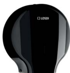
REF: CP-0204-C-BL Acabado NEGRO