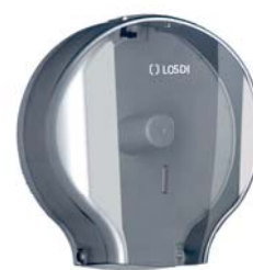
REF: CP-0204 Acabado FUMÉ