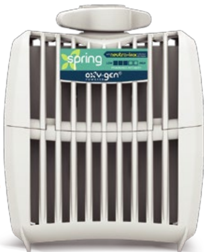
Recarga regular 30 Días

Al utilizar la recarga Grande , el dispensador puede programarse para funcionar durante 30, 60 o 90 días. La recarga contiene 35 ml de esencia pura de fragancia que equivale aproximadamente 7 veces más esencia que una fragancia en aerosol estándar. La intensidad de la fragancia puede cambiarse a un aroma muy intenso (30 días), normal (60 días) o suave (90 días).