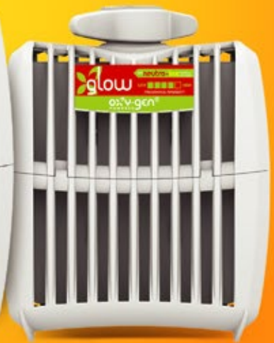
Recarga regular 30 Días