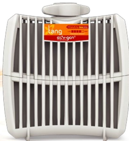
Recarga Grande 30/60/90 Días

A diferencia de los aerosoles, el sistema Oxygen-Pro no contiene CFCs, no tiene VOCs ni propulsores añadidos, no manchan, no mojan, ni hacen ruido. Un nivel fresco y constante de fragancia se libera de forma continua, consistente y discreta. Las recargas se pueden desechar de forma segura al final de su vida útil en un contenedor de reciclaje de plástico.