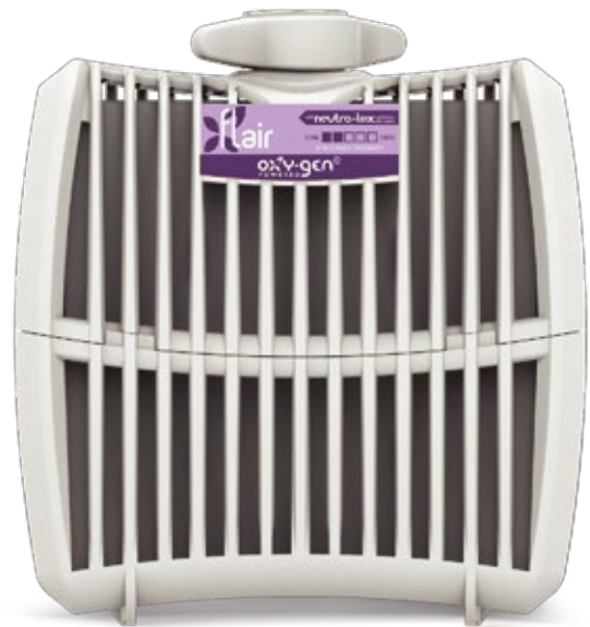
Recarga Grande 30/60/90 Días

El dispensador detecta automáticamente la recarga Grande y funciona según el ajuste elegido. La recarga Regular funciona durante 30 días independientemente de la posición del interruptor programado.