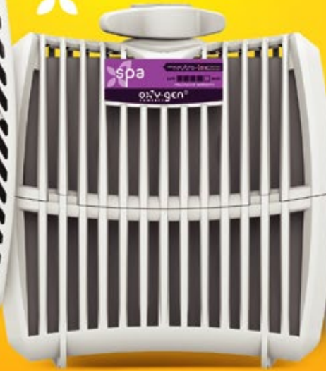
Recarga grande 30/60/90 Días